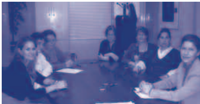
Grupo de participantes en el taller

Tras el éxito del Taller realizado el año pasado continuamos en esta línea de acción y este año ofertamos el taller "Cuidando al cuidador".